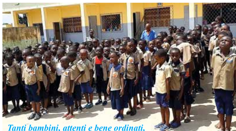
Tanti bambini, attenti e bene ordinati, prima dell'entrata in classe