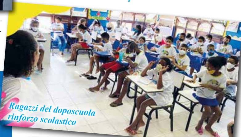
Ragazzi del doposcuola rinforzo scolastico