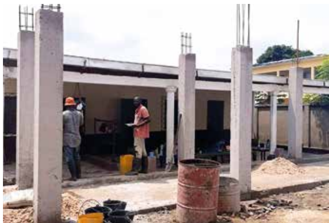
Il Collège in costruzione