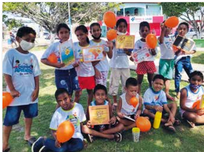
I bambini per le strade di Tamandarè

Inoltre in occasione della “Giornata Mondiale control'abuso e lo sfruttamento minorile” i bambini hanno compiuto una manifestazione di sensibilizzazione per le strade di Tamandarè per mantenere viva la memoria nazionale e rafforzare le responsabilità della società brasiliana nel garantire i diritti di tutti i bambini e degli adolescenti.