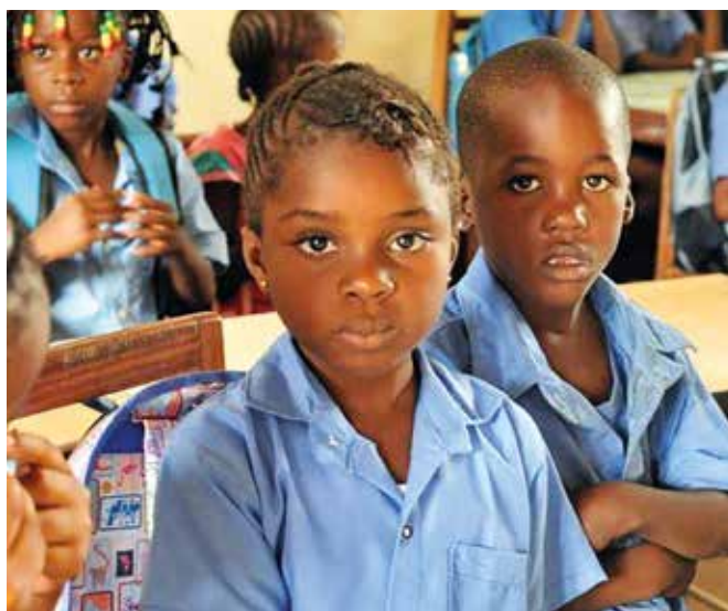
Brazzaville, la scuola è certezza per il loro futuro

È certamente una verità affermare che occuparsi degli altri, soprattutto di chi sta peggio di noi, ci aiuta a vedere con più equilibrio anche i nostri problemi e le nostre difficoltà. Ogni tanto uscire dal nostro egocentrismo e compiere qualche gesto di generosità ci fa sentire meglio. La nostra finalità è il Progetto Tamarandè e il nostro invito è quello di ricordarsi dei bambini del Centro Solidarietà di Tamarandè e di quelli della Scuola Medea in Congo . Nelle scorse settimane abbondanti piogge hanno interessato il nord-est del Brasile e anche a Tamarandè vi sono stati degli smottamenti, distruzione di abitazioni e allagamenti che hanno interessato anche delle case dei funzionari e delle famiglie