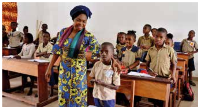
Un'aula di bambini delle Elementari con l'insegnante