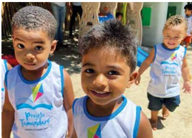
Bambini felici nel Centro Padre Enzo di Tamarandè