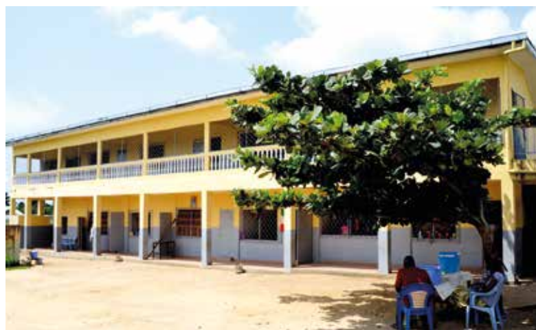
La Scuola Elementare Camilla Medea