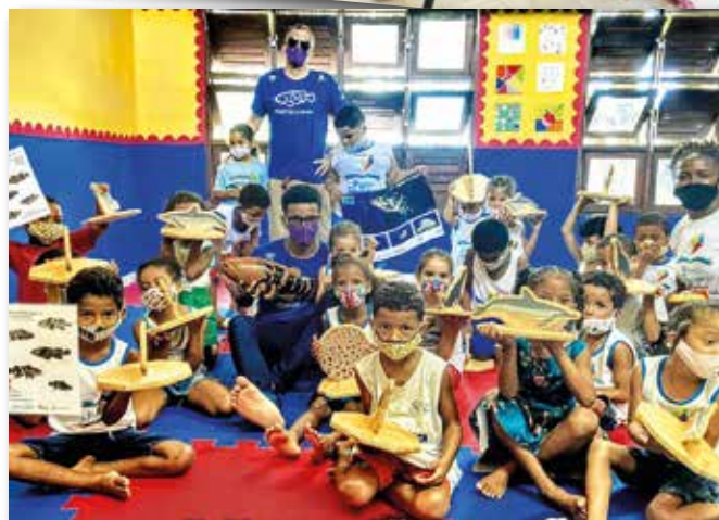
Nella “Giornata Mondiale dell'Ambiente” i bambini sono stati portati a conoscere, rispettare e amare l'ambiente, nostra Casa Comune.