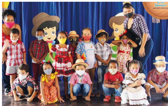
25 giugno San Giovanni, festa importante e tradizionale per il Brasile. I bambini ed i ragazzi hanno festeggiato con rappresentazioni e danze in costume

Giugno, essendo il mese in cui cade l'anniversario di Padre Enzo, è stato dedicato in particolare a far conoscere ai bambini e agli alunni la vita del fondatore del progetto, le iniziative che ha sviluppato da parroco nella comunità di Tamandaré. Il senso profondo del ricordo del missionario italiano Padre Enzo è quello di maturare nei bambini piccoli il valore della solidarietà, dell'amicizia tra persone di paesi e mondi lontani. Intanto dagli inizi della pandemia