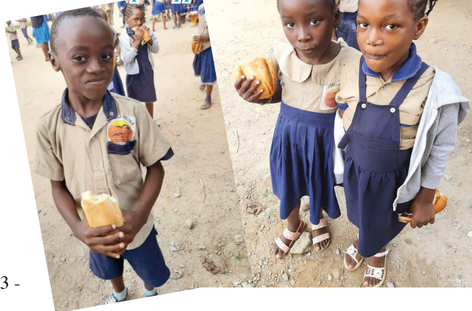
Dopo l'attività in aula... la merenda è più appetitosa