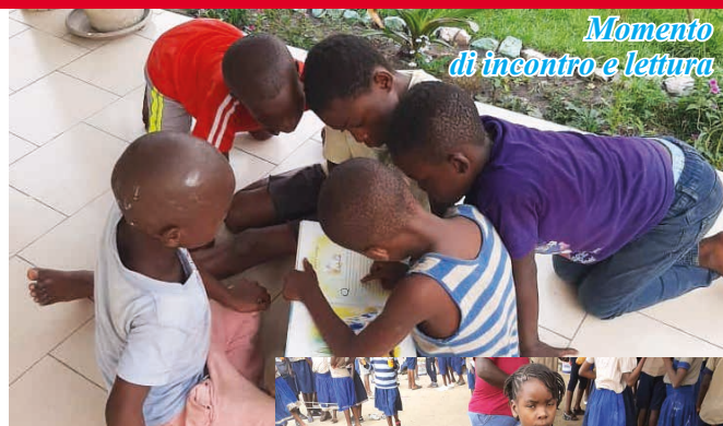
Momento di incontro e lettura