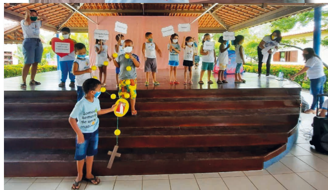
I bambini ed i ragazzi in vari modi si sono avvicinati alla vita di Padre Enzo per conoscere la sua storia, il suo lavoro, la sua missione e la sua eredità

dell'anno scorso continua il massiccio impegno del Centro a sostenere quotidianamente le famiglie dei bambini con aiuti alimentari e di altro materiale sanitario.