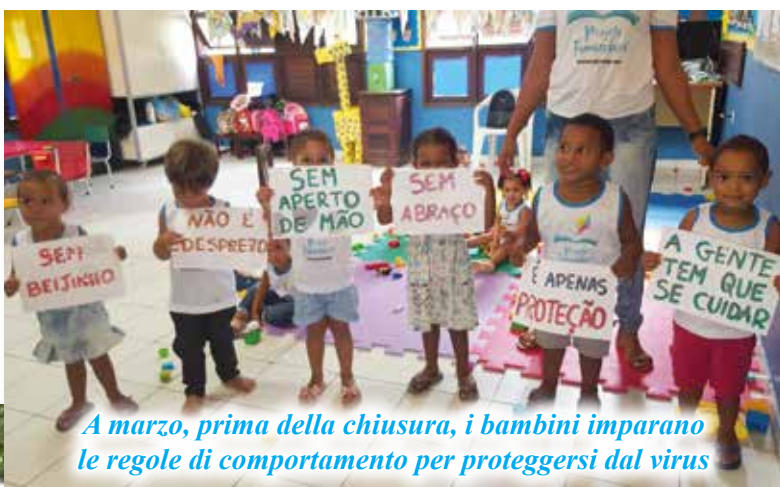
A marzo, prima della chiusura, i bambini imparano le regole di comportamento per proteggersi dal virus

Cari benefattori e amici del "progetto Tamarandè", stiamo attraversando un periodo della nostra vita che non ci saremmo mai aspettati; pensate che ancora all'inizio di febbraio scorso noi stavamo organizzando un evento importante nella vita della nostra associazione per il 24 maggio 2020: i 25 anni di attività del "Progetto Tamarandè" e i 20 anni dalla scomparsa del fondatore Padre Enzo. Improvvisamente tutto si è fermato, anche le nostre vite relegate in casa hanno dovuto ritrovare ritmi diversi e significati nuovi. Questa pandemia