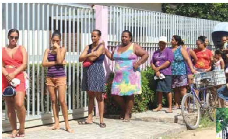
Mamme della Favela in attesa davanti al Centro