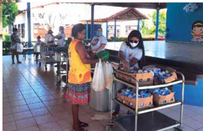
Distribuzione di vari alimentari nel cortile del Centro

Oltre alla zuppa giornaliera è cominciata anche la distribuzione, in alcuni casi a domicilio, delle “ceste basiche” (pacchi contenenti prodotti alimentari di base come riso, fagioli, latte, biscotti, pasta etc) che possono alimentare una famiglia per una o più settimane. Così nell'attesa di una normalizzazione della situazione e quindi di poter riprendere l'attività educativa, il Centro si mantiene in stretto contatto e tutela la salute dei suoi bambini, degli alunni e delle loro famiglie.