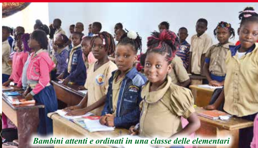
Bambini attenti e ordinati in una classe delle elementari