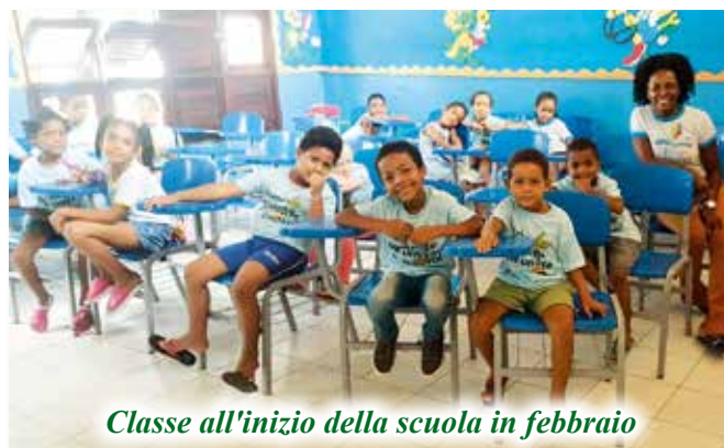
Classe all'inizio della scuola in febbraio

Un accordo innovativo di collaborazione è stato siglato tra il nostro Centro Solidarietà Padre Enzo e la Segreteria dell'Educazione del Comune di Tamandaré . Come noto, a differenza della nostra scuola materna che ospita i bambini dai 2 ai 6 anni per l'intera giornata, gli alunni della scuola elementare arrivano al Centro per il "doposcuola" (apoio) dopo avere frequentato la scuola pubblica. Nel comune di Tamandaré esistono tre scuole pubbliche per le elementari e i nostri bambini venivano iscritti dalle famiglie a seconda delle loro comodità di vicinanza o di conoscenza. Le nostre insegnanti si trovavano a gestire gruppi di bambini seguiti da diverse insegnanti di scuola e con diverse modalità di insegnamento o diverso stato di avanzamento dei programmi. Con l'accordo siglato quest'anno tutti i bambini che hanno frequentato da noi l'ultimo anno di scuola materna vengono iscritti in una unica scuola pubblica e viene ufficializzato il dialogo e la collaborazione tra le due rispettive insegnanti. Uniformando le metodologie didattiche e attraverso lo scambio di valutazione degli alunni, si potrà assicurare loro una migliore formazione e seguire meglio quelli con più