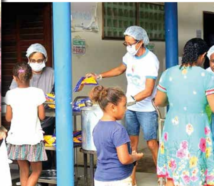
Distribuzione della minestra e di generi alimentari

Nelle settimane successive, e dopo il manifestarsi di alcuni contagi nel territorio del paese, il Centro ha assunto anche la funzione di informazione e di prevenzione dei rischi, invitando all'abitudine del “distanziamento” tra le persone e all'uso della mascherina.