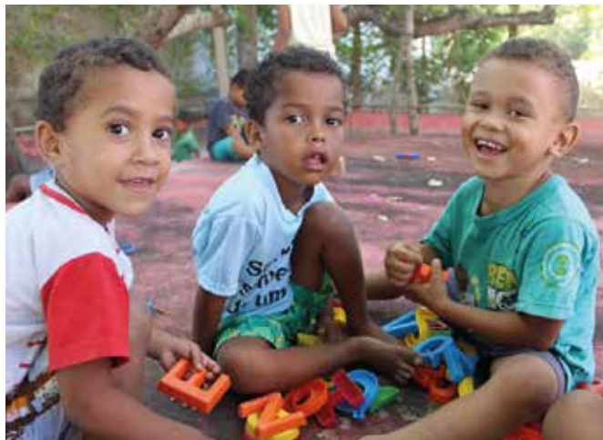
Il Covid-19 toglie l'allegria del Centro

Ci trovavamo in visita a Tamandaré dopo il 20 marzo scorso quando è scattata la “quarantena” per il Covid-19 anche in Brasile con il conseguente divieto di continuare le attività educative sia nella materna che nel doposcuola per gli alunni delle elementari.