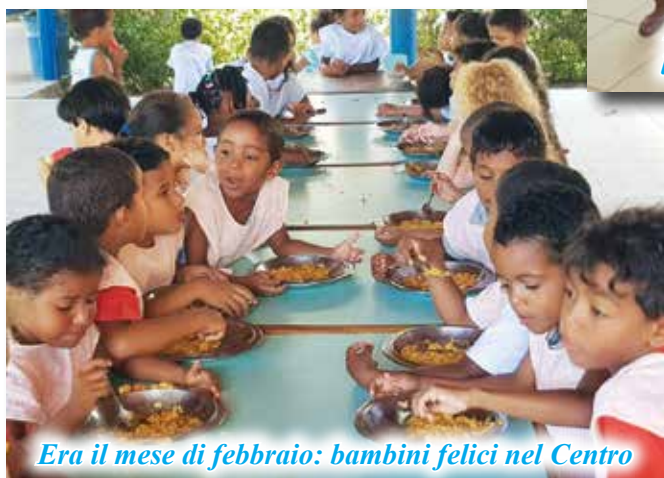
Era il mese di febbraio: bambini felici nel Centro

ha interessato tutto il resto del mondo incidendo anche nelle attività svolte nel Centro Solidarietà Padre Enzo in Brasile e nella missione delle Medee in Congo . A Tamarandè la direzione del Centro ha dovuto fermare le attività educative ma nello stesso tempo ha intensificato l'attività di assistenza sociale alle famiglie dei bambini fornendo centinaia di pasti quotidiani e distribuendo prodotti alimentari e di igiene in base ai nuclei familiari.